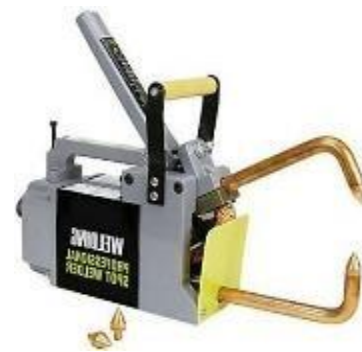
Figura 2. Máquina soldadora de puntos portátil [2].