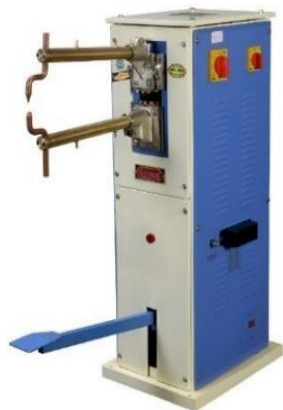
Figura 1. Máquina soldadora de puntos por pedestal [1].

El presente proyecto consiste en el diseño y fabricación de una soldadora de puntos portátil. La máquina funcionará con el suministro de corriente alterna residencial (127 V y 60 Hz), para soldar piezas de lámina de acero al carbono de hasta 1 mm de espesor (calibre 18) (Figura 2).