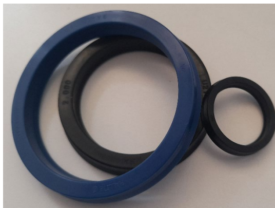
Figura 1. Sellos para cilindros hidráulicos.

La utilidad de diseñar un dispositivo de pruebas es que se podría someter a sellos nuevos a las condiciones de trabajo para verificar el desgaste al deslizarse en dos tipos de superficies: cromadas y nitruradas. Gracias a esto se podría validar la calidad de un producto y un funcionamiento adecuado de este en un vástago y chumacera de cilindros hidráulicos.