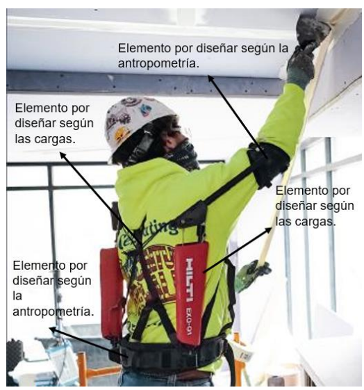
Imagen 3 Elementos a diseñar del tren superior [8]