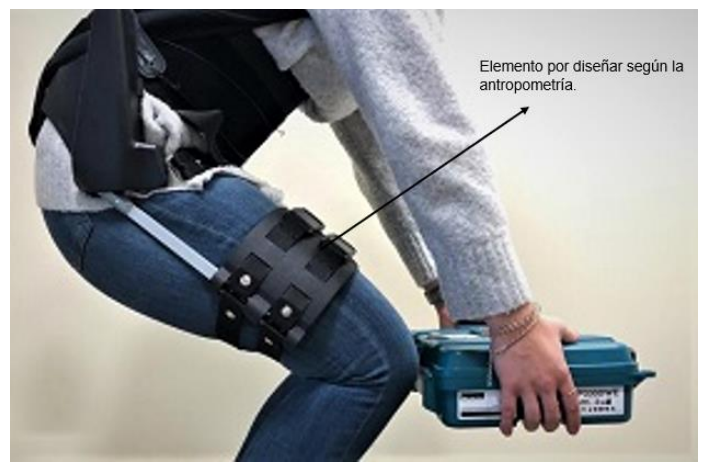
Imagen 4 Elementos a diseñar del tren inferior [9].