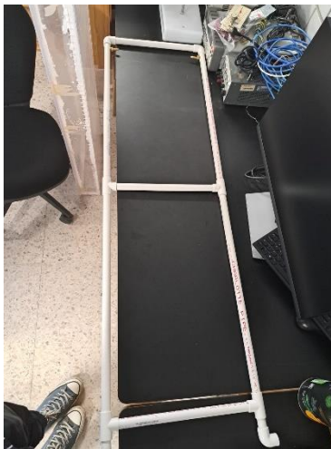
Figura 2. Foto de la conexión de tuberías que van dentro del reservorio de acrílico.