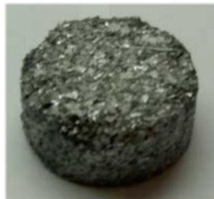
Figura 2. Briqueta obtenida en prueba de laboratorio [2].