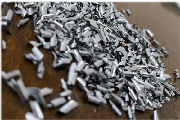
Figura 1. Viruta de aluminio del Taller Mecánico.

Siguiendo dicha literatura, se diseñará el contenedor para compactar la viruta seleccionando el actuador hidráulico. Posteriormente, se diseñarán y construirán las estructuras para el dispositivo de lavado y para el compactador. Finalmente se harán pruebas a los bloques para verificar su aplicación en el taller de fundición.