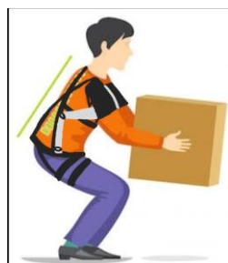
Imagen 1 Figura propia

El diseño está destinado a un grupo de trabajadoras que residen en Tizayuca Hidalgo, con edades entre los 30 y 50 años, utilizando medidas antropométricas como referencia. Se realizará un análisis de exoesqueletos del mercado, como referencia a un diseño propio que satisfaga las necesidades de movimiento y confort en las sujeciones que tendrá en el cuerpo de la trabajadora para largas jornadas laborales.