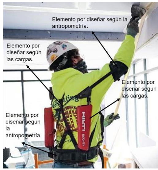
Imagen 3 Elementos a diseñar del tren superior [8]