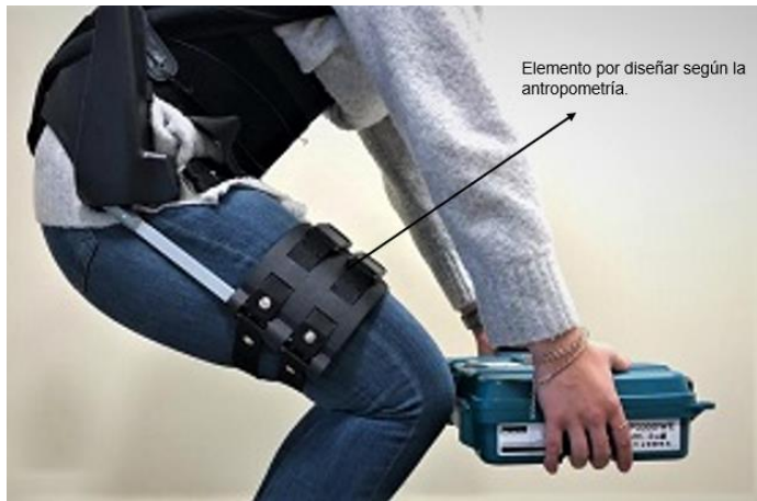
Imagen 4 Elementos a diseñar del tren inferior [9].