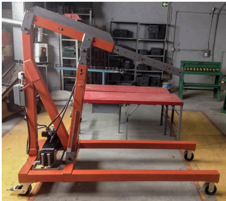
Ilustración 1. Grúa hidráulica a intervenir para monitoreo y control remoto.

Se intervendrá una grúa hidráulica tipo pluma para dotarla con las capacidades de automatización necesarias para el monitoreo y control remoto. Para ello, será necesario rediseñar el sistema de alimentación de potencia y los sistemas de regulación de caudal y control de la velocidad del actuador lineal. Se seleccionarán los componentes electrónicos para la comunicación WiFi, que permitirán el enlace vía remota con la grúa hidráulica a través de Internet. También se diseñará un programa para establecer los protocolos de comunicación a través de Internet y se desarrollará una interfaz gráfica, para monitorear y gobernar la grúa hidráulica y corregir su desempeño. El sistema se ensayará con la ejecución de pruebas de monitoreo remoto en condiciones de funcionamiento real de la grúa.